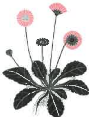
Exposition LES HERBIERS d'Émilie Vast éditions MeMo

16 panneaux : 1 panneau de présentation + 15 illustrations : Plantes sauvages des villes (Pissenlit, Morelle noire, Vergerette du Canada, Sureau, Clématite vigne blanche) Petite flore des bois d'Europe (Anémone Sylvie, Oxalis des bois, Gouet, Perce-neige, Véronique officinale) Arbres feuillus d'Europe (Hêtre, Robinier, Chêne, Aulne, Erable)